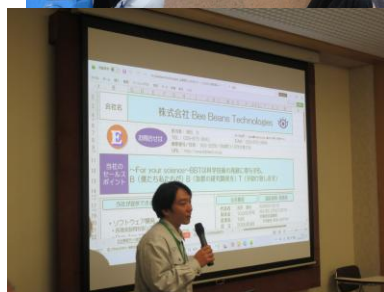
会員企業のPRプレゼンテーション