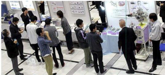
盛況だった産総研技術展示会の会場模様