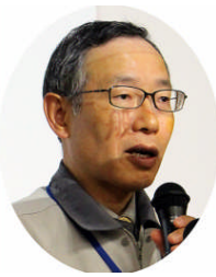
原子力機構 宮川部長