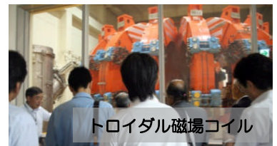
トロイダル磁場コイル

9月29日(木)13時15分から、量子科学技術研究機構・那珂核融合研究所(那珂市)に於いて、同研究所と茨城県が主催し、当協議会が協力して、研究装置や設備機器への支援が期待される県内企業向け見学会が開催されました。この見学会には21企業36名(含事務局)が参集し、意欲的な見学会となりました。