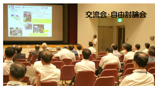
交流会・自由討論会

情報交流や設備機器、或いはソフトウェアを含む運用ツールの製作・供給の検討開始など新たな協力関係のスタートが期待されます。